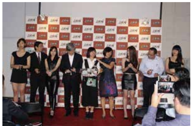
廣電系101級畢業展VIP之夜剪綵儀式