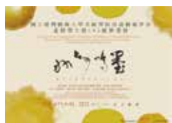
書畫藝術學系進修學士班105級畢業展海報