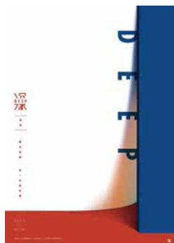
新一代設計展「深色Deep」