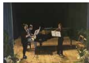
音樂系學生義大利室內樂發表演出

國際事務處預定於9月、10月、11月各舉辦一場次「獎助學生參加國際教學展演競賽實習」成果心得分享會，由受獎助同學分享團隊至國外交流展演的學習心得與寶貴收穫，歡迎同學留意校首頁公告，踴躍報名參加。