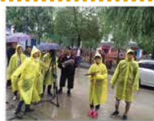
電影系參加兩岸交流活動與微電影製作

另音樂系3位同學於6月底遠赴義大利參加Interharmony音樂節，期間共有數十場各國各項樂器優秀教授所開授的大師班，皆由學生自行填寫想讓哪位大師指導，另有主修課程、室內樂課程、每天晚上都有音樂會。同學表示，藉此活動，原本在臺灣如井底之蛙的眼界，就此開闊，並能與年齡相仿，甚至還非常年幼，琴藝卻又如此了得的年輕音樂學生互相切磋、討教，獲益良多。同學也對音樂節期間有位鋼琴大師說，不要在意丟臉，在意一輩子都學不會，如果把注意力放在不犯錯上，不容易享受音樂，要用最自然的方式演奏，體認到學習任何東西應該都是要這樣的。