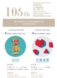
105年度 國立臺灣藝術大學 學生學習成果展演活動補助申請案

105年度教學卓越計畫辦理「學生學習成果展演補助」係為協助本校各學系提昇教學品質及發展系所特色、促進學生學習成效、鼓勵學生積極參與校內外展演活動、提升教學績效。共計全校14系所有13系所之特色展演獲得補助，除了靜態之展覽性質之外，亦包含動態舞蹈、戲劇、音樂類表演，其補助成效彰顯。