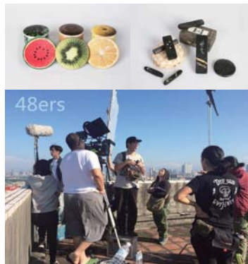
圖：104年度文創工作室成果

104年度文創工作室計畫精彩落幕，去年由書畫系-墨非墨工作坊、圖文系-Top Pix Arts創新影像工作室、音樂系-藝游未盡[跨領域視覺音樂工作室]、廣電系-魁星文創工作室及電影學系-48小組產出卓越的成果。上屆成果展示多樣性領域的作品，學生在與指導老師及業界人士的帶領之下不但增加了自我分析、團隊合作的能力也體驗不同的大學生活！